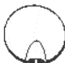
Vzduchová regulace hydromasáže +/-